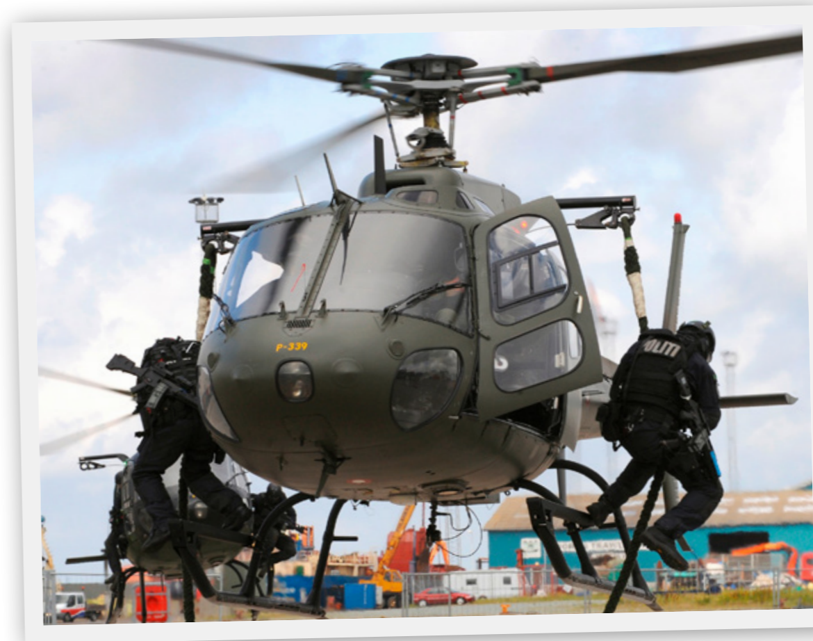
Politiets Aktionsstyrke fylder 50 år. Anti-terrorenheden opstod i 1973 i kølvandet på gidseltagningen af flere israelske atleter under de olympiske lege i München i 1972, samt flykapringer begået af terrorister i Beirut og Malmø kort efter.

Det var politiets Aktionsstyrke, der pågreb gerningsmanden bag skuddramaet på Christiania den 31. august 2016, og det var Aktionsstyrken, der skød og dræbte manden bag terroranslagene mod Krudttønden og den jødiske synagoge i København 2015. Operationerne har gjort Aktionsstyrken kendt i offentligheden, men der er næppe mange, der kender noget nærmere til styrken , der med årene har fået en større og større betydning for politiets virke i Danmark – og i år fylder 50 år.