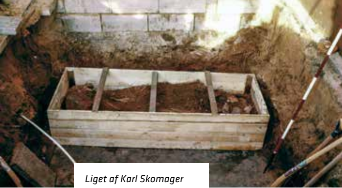
Liget af Karl Skomager blev gravet op og placeret i en specialbygget kasse.