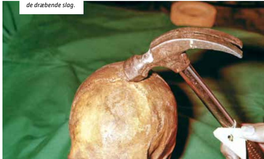
Rekonstruktion af de dræbende slag.