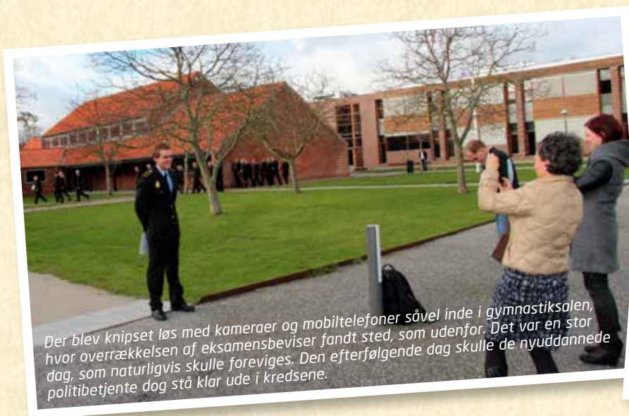
Der blev knipset løs med kameraer og mobiltelefoner såvel inde i gymnastiksalen, hvor overrækkelsen af eksamensbeviser fandt sted, som udenfor. Det var en stor dag, som naturligvis skulle foreviges. Den efterfølgende dag skulle de nyuddannede politibetjente dog stå klar ude i kredsene.

DANSK POLITI var med, da 203 politielever fik udleveret deres eksamensbeviser den 30. oktober. Det var også afslutningen på en epoke, fordi disse ni klasser var de sidste på den gamle politiuddannelse – PG-uddannelsen – som har eksisteret i 38 år. I dag er uddannelsen som bekendt lavet om til en professionsbachelor.