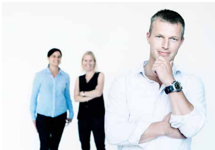
Redaktionen på fagbladet DANSK POLITI ▲