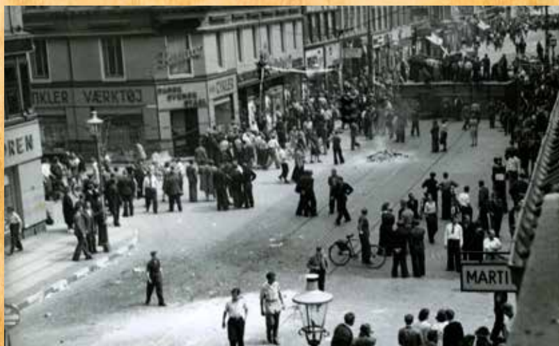
Nørrebro var uroens epicenter. På Nørrebrogade blev der bygget et stort antal barrikader, som besættelsesmagten fjernede med hård hånd. Cirka 30 mennesker blev dræbt på Nørrebro.

Herefter sørgede Bovensiepen for at bemane flere lastbiler med mandskab, som han derpå sendte ud til Nørre- og Vesterbro, hvor uroen var størst. Disse enheder skulle medvirke til at eskalere uroen og volden voldsomt. Svært bevæbnede med maskinpistoler angreb de grupper over fem personer med salver fra deres våben. Hertil kom, at der blev stillet kanoner op ved Dronning Louises Bro, der skød ned ad Nørrebrogade ligesom et bombefly i et tilfælde fløj hen over bydelen og bestrøg Sankt Hans Torv med maskingeværkugler. Alene disse angreb kostede 10-15 mennesker livet. En del tyske soldater blev dog også slået ihjel. Et betydeligt antal af de faldne på tysk side skyldtes dog den dårlige koordinering