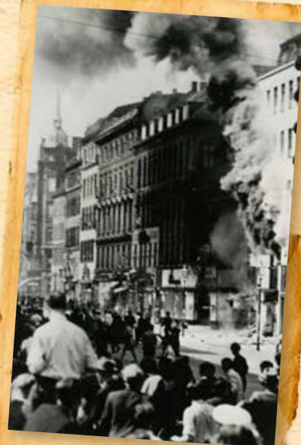
Afbrændingen af Bulldog var et sandt inferno. Flere mennesker var ved at blive trampet ihjel, da varehuset blev stormet, og mens ilden rasede dukkede medlemmer af Schalburgkorpset op og skød vildt omkring sig.

Da københavnere dertil følte sig forulempet af sprængningerne af Spejlsalen i Tivoli og Borgernes Hus den 24.-25. juni, var målet fuldt, og hovedstadens befolkning begyndte at rejse sig mod besættelsesmyndighederne ved at bygge barrikader og tænde bål i gaderne, hvilket det tyske politi besvarede ved at åbne ild mod de sammenstimle-