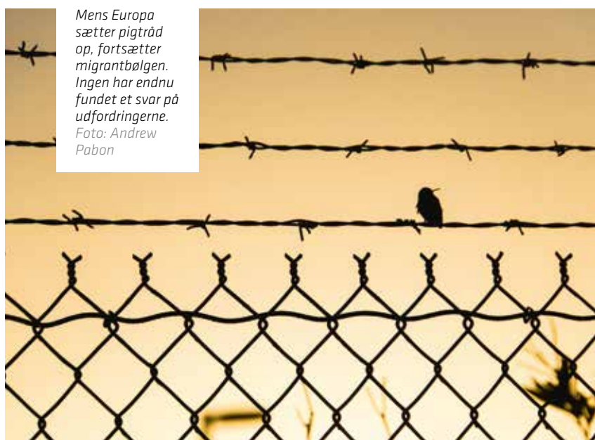
Mens Europa sætter pigtråd op, fortsætter migrantbølgen. Ingen har endnu fundet et svar på udfordringerne.

Danmark har pr. 1. juli i år modtaget 5.174 asylansøgere. Tilsvarende tal for de samme måneder sidste år var 5.595. I 2014 modtog Danmark i alt 14.792