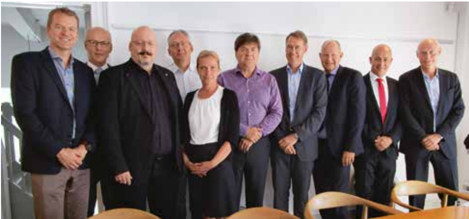
De nordiske rigspoliti- chefer og forbunds- formænd for poli- tiorganisationerne i Nordisk Politiforbund mødtes i august på Dragsholm Slot.