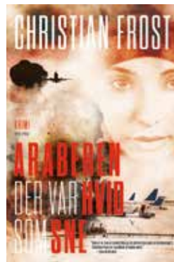
ARABEREN DER VAR HVID SOM SNE Skrevet af: Christian Frost Forlag: PEOPLE'S PRESS

BOG En søndag i juli 2015 rammer et terrorangreb Københavns Lufthavn. Bevæbnede mænd angriber den fyldte afgangshal på årets første store rejsedag og dræber i hundredvis af uskyldige, inden de forsvinder sporløst.