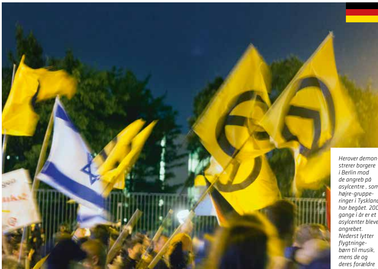
Herover demonstrerer borgere i Berlin mod de angreb på asylcentre, som højre-grupperinger i Tyskland har begået. 200 gange i år er et asylcenter blevet angrebet. Nederst lytter flygtningebørn til musik, mens de og deres forældre venter på at blive registreret som asylansøgere i Tyskland.