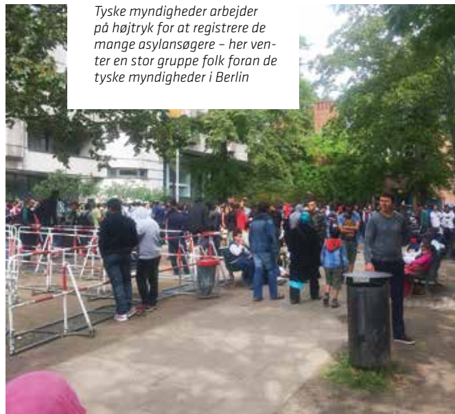
Tyske myndigheder arbejder på højtryk for at registrere de mange asylansøgere - her venter en stor gruppe folk foran de tyske myndigheder i Berlin