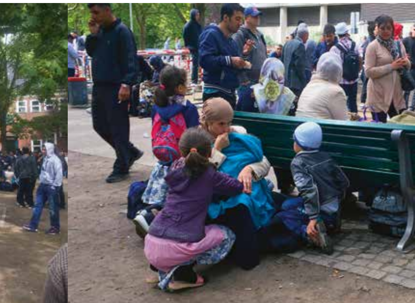
Tyskland har pr. 1. august i år modtaget 300.000 asylansøgere. Man anslår, at omkring 70.000 af dem er fra Balkan.

Der er nok af udfordringer, som kan give hovedbrud til de ansvarlige og ansatte hele vejen fra politi til øvrige myndigheder, skole, socialarbejdere og andre.