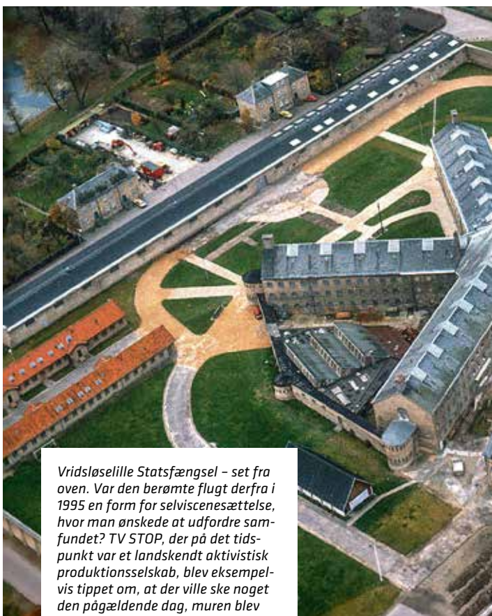
Vridsløselille Statsfængsel – set fra oven. Var den berømte flugt derfra i 1995 en form for selvviscenesættelse, hvor man ønskede at udfordre samfundet? TV STOP, der på det tidspunkt var et landskendt aktivistisk produktionsselskab, blev eksempelvis tippet om, at der ville ske noget den pågældende dag, muren blev væltet. Optagelserne blev efterfølgende solgt til alverdens tv-selskaber.